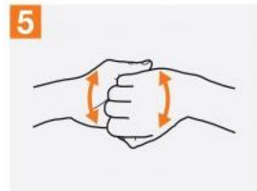
5 انگشت ها را در هم تابیده به حالت قفل شده و پشت انگشت ها به کف دست مقابل مالش داده شود