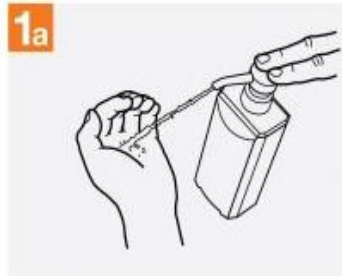
1a کف دست را با مقدار کافی ضد عفونی کننده الکلی پر کنید

تصویر (۲) ضدعفونی دست با محلول های ضدعفونی کننده حاوی الکل