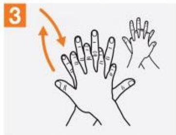
3 کف دست راست را روی پشت دست چپ گذاشته و بین انگشت ها را اسکراب کنید و برعکس