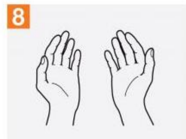
8 دست ها آماده است