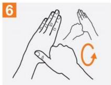
6 انگشت شست دست چپ را با کف دست راست احاطه کرده و به صورت دورانی مالش دهید و برعکس