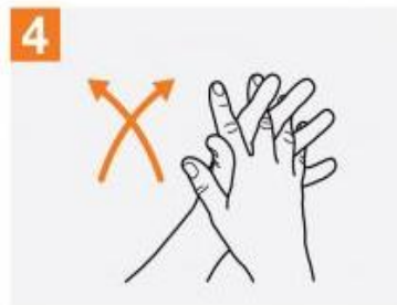
4 کف دست ها روی هم قرار گرفته و ما بین انگشتان را مالش دهید