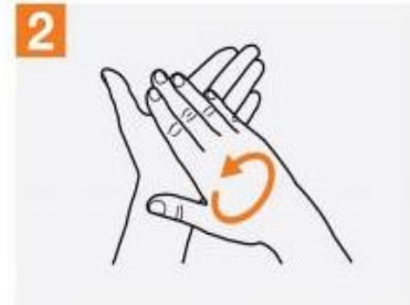
2 کف دست ها را به هم بمالید