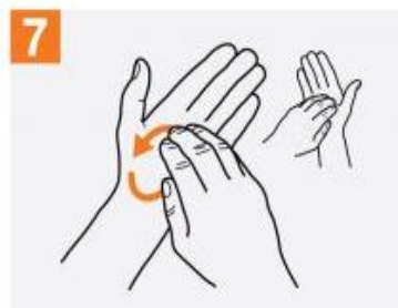
7 انگشتان را جمع کرده به صورت چرخشی در کف دست مقابل حرکت دهید و برعکس